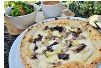
阿蘇自然豚のサルシッチャと きのこのピッツア

アンチョビ入りトマトソースに ほうれん草・ベーコン・マッシュル ーム、とろーり半熟卵が絶妙!