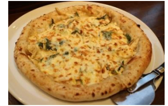
蒸し鶏と大葉の ゆず風味ピッツア

サルシッチャ(ひき肉ソーセージ)の 香ばしさとモッツアレラチーズの風味が 季節の野菜と相性抜群!