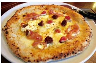
生ハムといちぢくの クワトロフォルマッジ