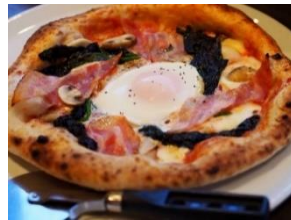
ほうれん草とベーコン のビスマルク

ゴルゴンゾーラ・モッツアレラ・マスカル ポーネ・グラナパダーナを使い、トッピング には生ハムといちぢく!ハチミツをかけて どうぞ!